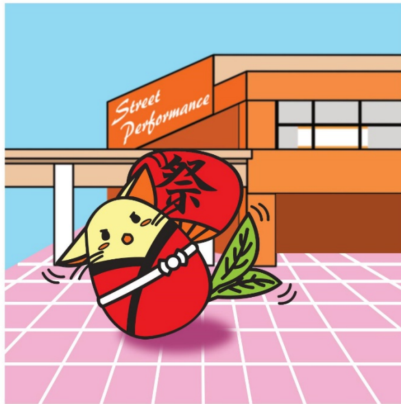
千葉大祭公式キャラクター【はっぴ】